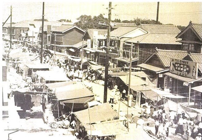
写真1 内野大火後の盆の市（二番町付近）

写真は、昭和25年の新川河口左岸のイワシ漁の船とイワシ網の干場の様子です。中央に見えるのは、当時河口にあった渚橋 なぎさ です。昭和46年に新川河口排水機場が通水すると、河口に近い渚橋は少し上流側に架け替えられました。現在は河口の隣に新川漁港が整備され、冬の水ダコ漁が有名です。