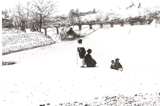
写真2 奥手山付近桜の花見（新川堤の桜）