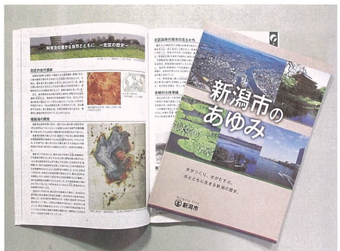
増補改訂版『新潟市のあゆみ』

さらに、巻末には新潟市歴史文化課の利用案内を付け、利用日・利用時間、資料の閲覧・複写の方法、交通アクセスなどをご案内しています。ぜひとも新しい『新潟市のあゆみ』を活用して、新しい新潟市の歴史情報の発見や、皆様の学習等にお役立てください。入手方法については、歴史資料整備担当までお問い合わせください。