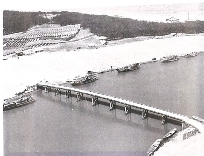
写真3 渚橋と網干し場と漁船