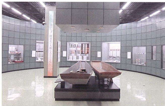
リニューアルした常設展示