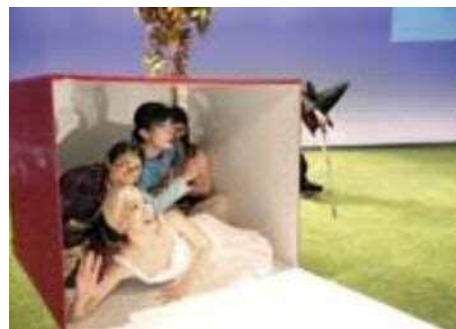
Noism1 近代童話劇シリーズ Vol.1 「箱入り娘」

日本初の劇場専用舞踊団として2004年に設立。今なお国内唯一の公共劇場専用舞踊団として、21世紀日本の劇場文化発展の一翼を担うべく、常にクリエイティブな活動を続けています。2015年は「水と土の芸術祭2015」の一環で、さまざまなパフォーマンスプログラムを実施しました。