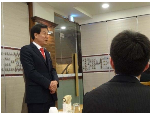
【清州市】朴鍾春市民委員長挨拶