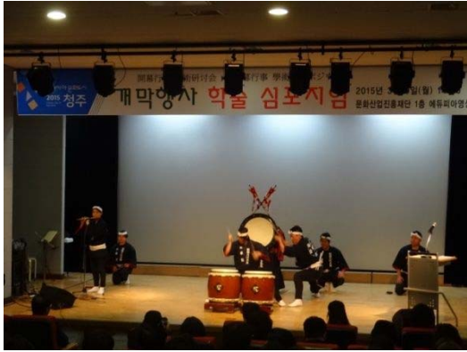
【新潟市】万代太鼓 華龍