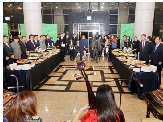
レセプションの様子