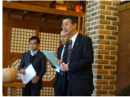
【新潟市】篠田昭市長挨拶