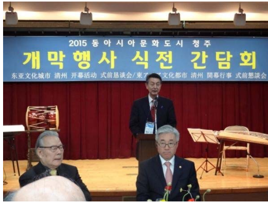
【新潟市】篠田昭市長挨拶