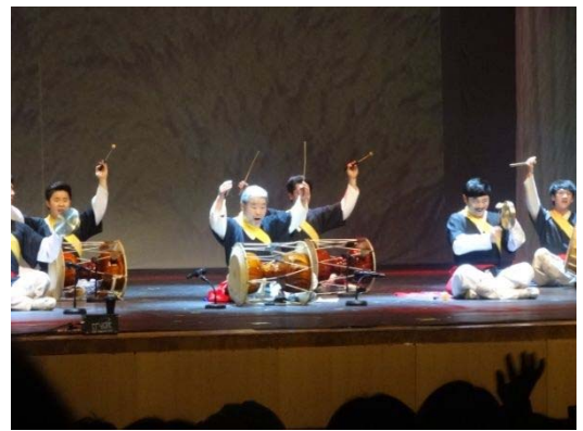
【清州市】ハンウルリム演劇団