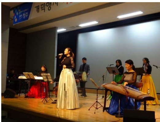
【清州市】音創造 エフォイ