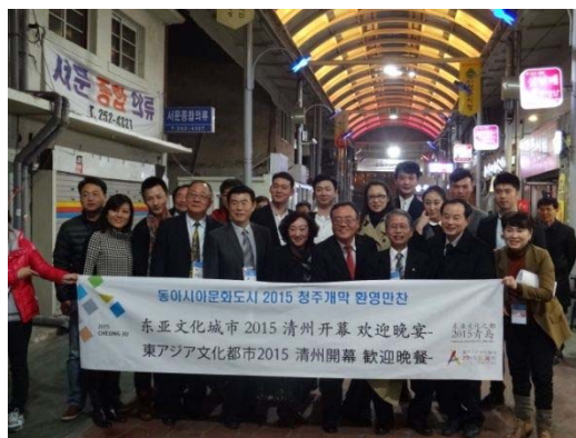
「サムギョプサル通り」にて記念撮影