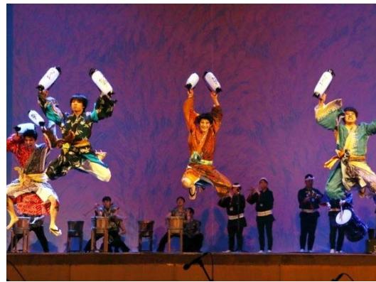
【新潟市】芸能団合同公演