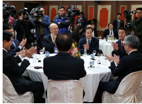
晩餐歓談会の様子