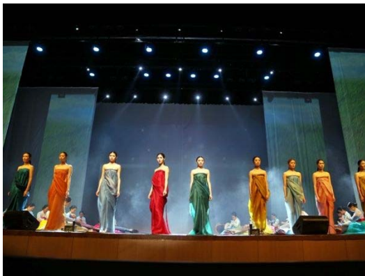
【清州市】ファッションショー