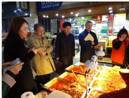
城安ギル 視察の様子