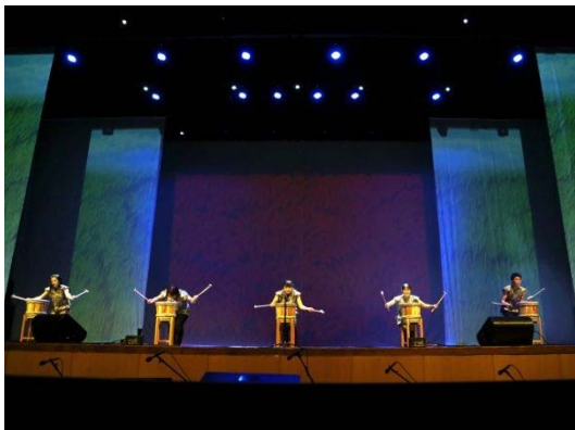
【新潟市】永島流新潟樽砵