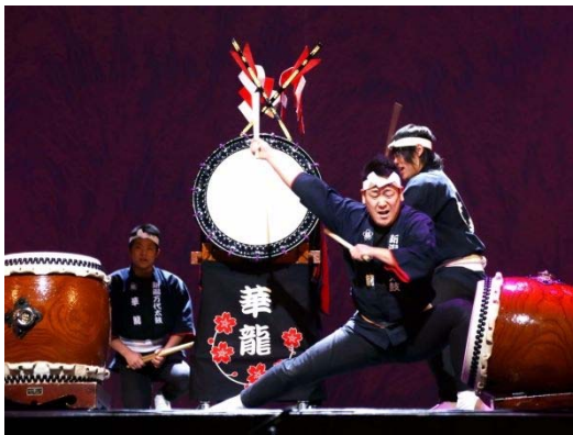
【新潟市】新潟万代太鼓 華龍