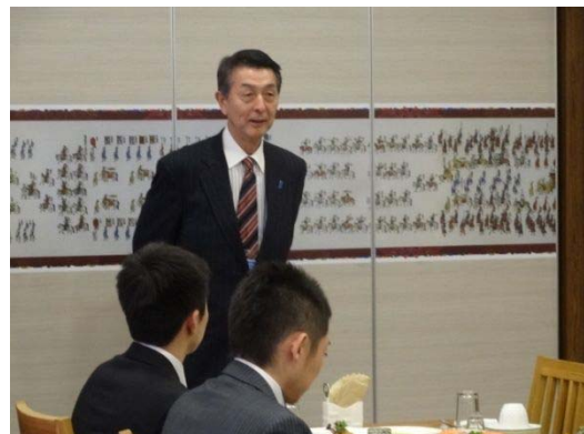
【新潟市】篠田昭市長挨拶