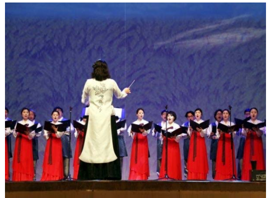
【清州市】市立合唱団