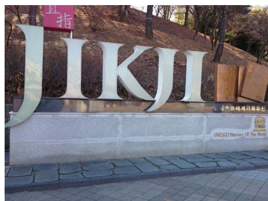
清州古印刷博物館