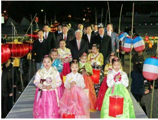
紙燈行事 来場者入場