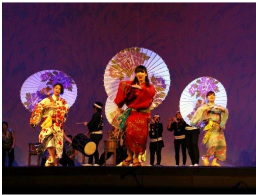
【新潟市】にいがた総おどり