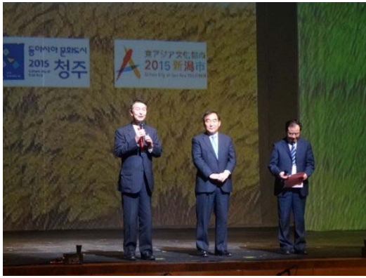
【新潟市】篠田昭市長挨拶