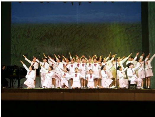
【清州市】アンジェラスドミニ合唱団