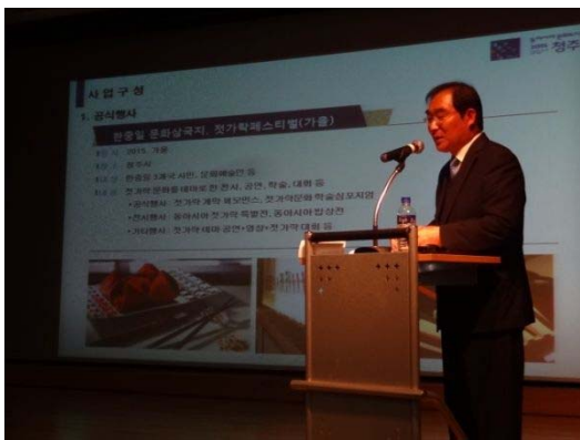
【清州市】李承勳市長