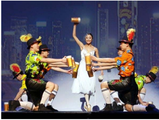
【青島市】青島市歌舞劇院