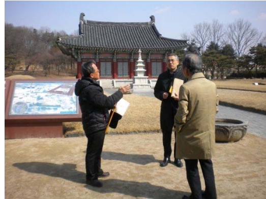
清州古印刷博物館