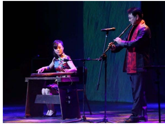
【青島市】青島市群衆芸術館