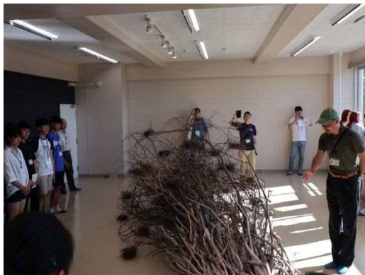
学芸員による展示作品の説明