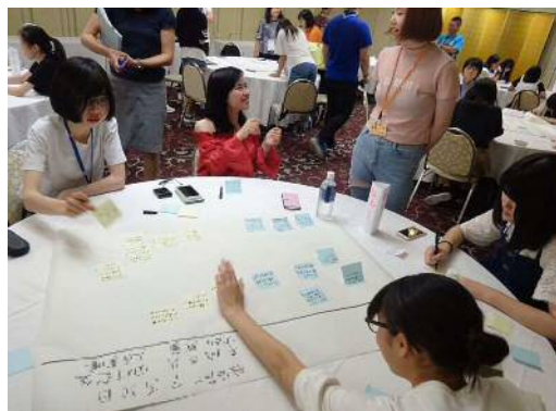
グループ内でのまとめの様子