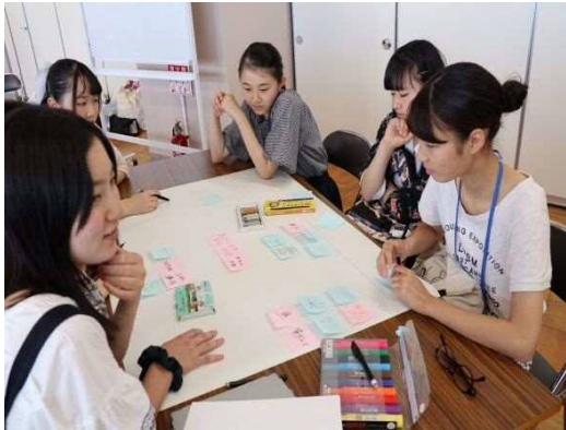
両都市の魅力を伝えるワークショップ