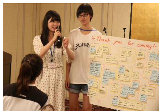
グループ代表による発表の様子