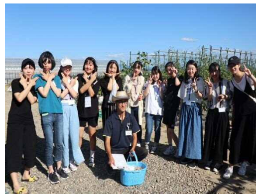
収穫終えて記念写真