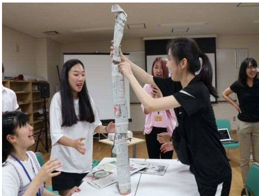
新聞紙を使ったペーパータワーゲーム