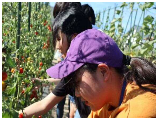
トマト・ナスなどの夏野菜を収穫体験