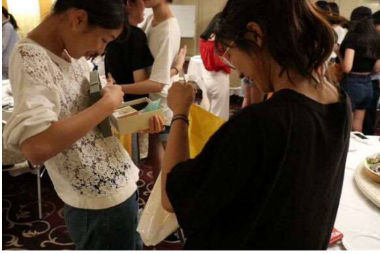
プレゼント交換の様子