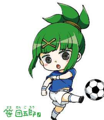
「マンガ・アニメのまちにいがた」 サポートキャラクター