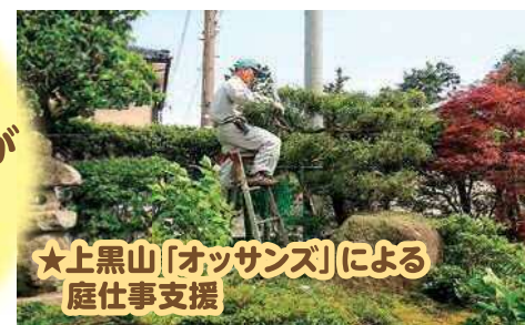
★上黒山「オッサンズ」による庭仕事支援