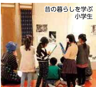
昔の暮らしを学ぶ小学生

北区で「着る」といえば？ 着るもので、北区とゆかりが深いものといえば、葛塚縮という木綿織物です。北区には、かつて、有名な木綿織物の産地がありました。その生産は、江戸時代後期に始まったと言われます。明治以降は機械化されて町の主要産業に発展し、昭和40年代後半まで生産されてきました。製品に、地名が付けられるほど評判になったのは、虫よけの効果がある