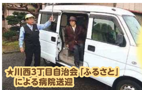
★川西3丁目自治会「ふるさと」による病院送迎