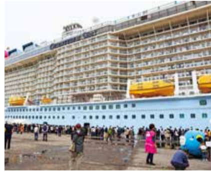
クワンタム・オブ・ザ・シーズ

《広告欄》広告掲載の申し込みは地域総務課 ☎387-1175 1 枠(3.9cm×7.9cm) 1 回7,000円(税込)