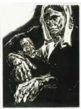
羽田信彌「乳も出ない」(1970)