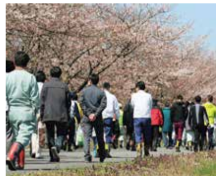
桜並木を歩く参加者

快晴に恵まれ、厚着では汗ばむ陽気のもと、さまざまなごみを拾い集めた結果、その総量はおよそ1.6トンでした。また、作戦中の散策はウォーキング代わりにもあり、約5,000歩を稼ぐいい運動となりました。