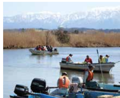
潟の中もきれいに