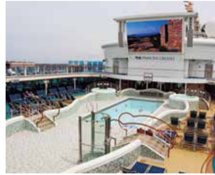
ダイヤモンド・プリンセス