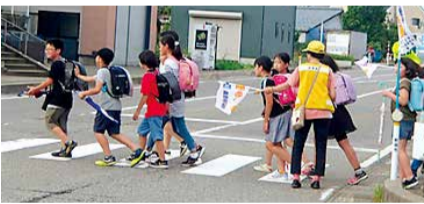
横断歩道は歩行者優先!

横断歩道での安全な横断を目的とした活動がスタートしました。7月4日(木)、新潟北警察署や新潟北交通安全協会などが、区内にある交差点の横断歩道で、下校中の小・中学生などに横断時の安全指導を行うとともに、ドライバーに歩行者優先を呼び掛けました。 問 区民生活課生活環境係(☎387-1295)