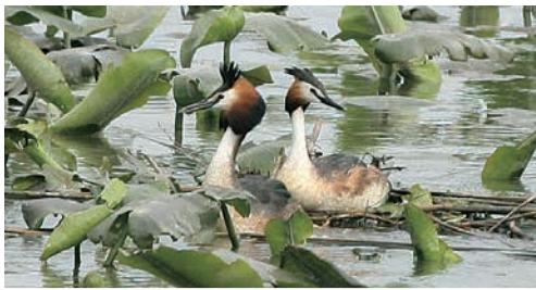
2012年福島潟で初確認された巣

水に潜っては魚を捕って食べるカイツブリという水鳥が福島潟にいます。地元では「ミヨセ」と呼ばれ、昔から親しまれています。ハトより小柄ですが「びるるるる」と転がすように鳴く声はよく通ります。