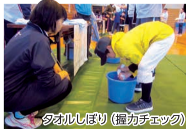
タオルしぼり(握力チェック)

タオルしぼりで握力、ストローで呼吸機能など、新潟県レクリエーション協会が考えた「いつでも・誰でも・簡単に」できる体力チェック!