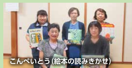
こんべいとう(絵本の読みきかせ)