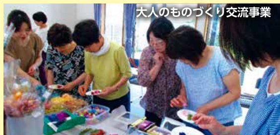
大人のものづくり交流事業