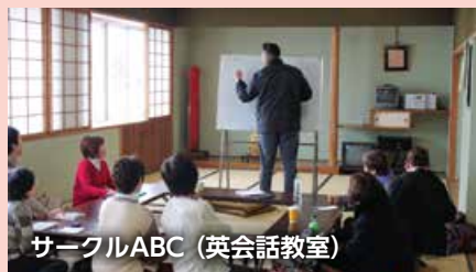
サークルABC(英会話教室)