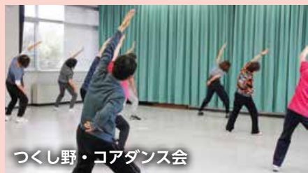
つくし野・コアダンス会

▽ヨガ ▽ダンス ▽英会話教室 ▽社交ダンス ▽大正琴 ▽コーラス ▽コアダンス