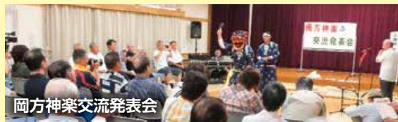
岡方神楽交流発表会

▽護身術(女性限定) ▽フラワーアレンジメント ▽健康体操 ▽フラダンス ▽バンド演奏 ▽創作活動