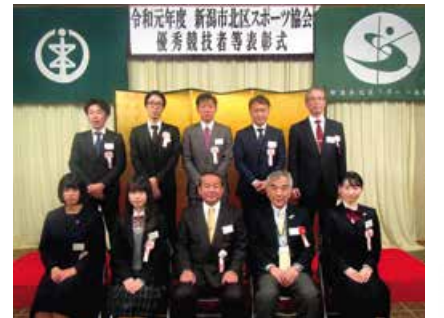
表彰式の様子から(2月8日(土)に開催)