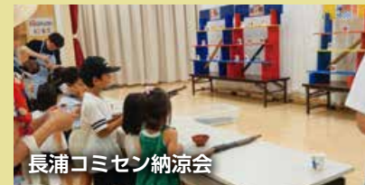
長浦コミセン納涼会

▽生け花 ▽オカリナ ▽社交ダンス ▽フラダンス ▽キッズダンス ▽フロアカーリング ▽パソコン ▽陶芸 ▽健康体操 ▽カラオケ ▽写真 ▽ヨガ ▽吹き矢