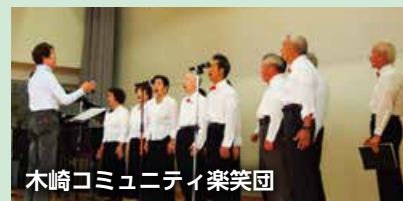
木崎コミュニティ楽笑団

▽フラワーアレンジメント ▽登山(木崎地区の人) ▽体操教室 ▽健康体操 ▽陶芸 ▽踊り ▽合唱 ▽囲碁 ▽生け花 ▽社交ダンス