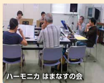
ハーモニカ はまなすの会