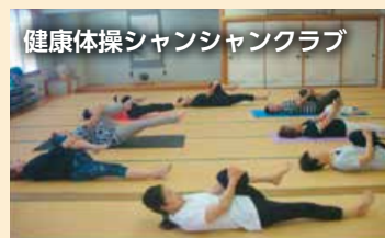
健康体操シャンシャンクラブ

▽油絵 ▽踊り ▽英会話 ▽空手 ▽詩吟 ▽民謡 ▽社交ダンス ▽三味線 ▽手芸 ▽大正琴 ▽ヨガ ▽太極拳 ▽吹き矢 ▽フラダンス ▽オカリナ ▽カラオケ ▽健康体操 ▽ハーモニカ ▽ラウンドダンス ▽フォークダンス ▽体幹トレーニング ▽フラワーアレンジメント ▽ヒップホップダンス