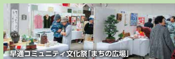
早通コミュニティ文化祭「まちの広場」