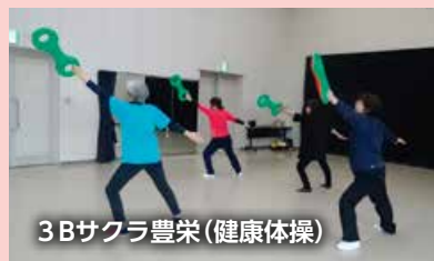
3Bサクラ豊栄(健康体操)

▽フォークダンス ▽フラダンス ▽フラワーアレンジメント ▽ボーイスカウト ▽社交ダンス ▽健康体操 ▽絵手紙 ▽空手 ▽太極拳 ▽登山 ▽俳句 ▽川柳 ▽絵画