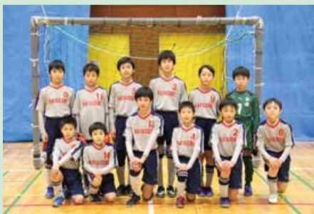
早通少年サッカークラブ