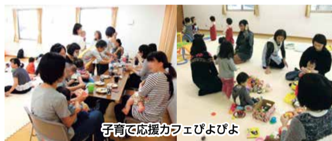
子育て応援カフェびびよ