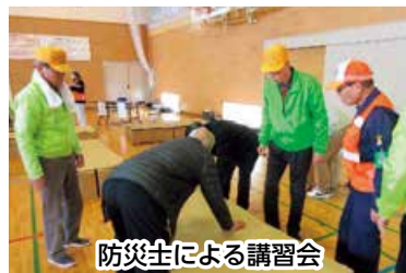
防災士による講習会