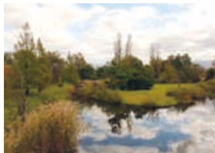
遊水館の公園(令和元年11月撮影)

円 1人100円(保険料)・当日払い 問 4月12日(日)から直接同館窓口または電話で同館