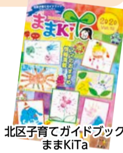
北区子育てガイドブック ままKITa