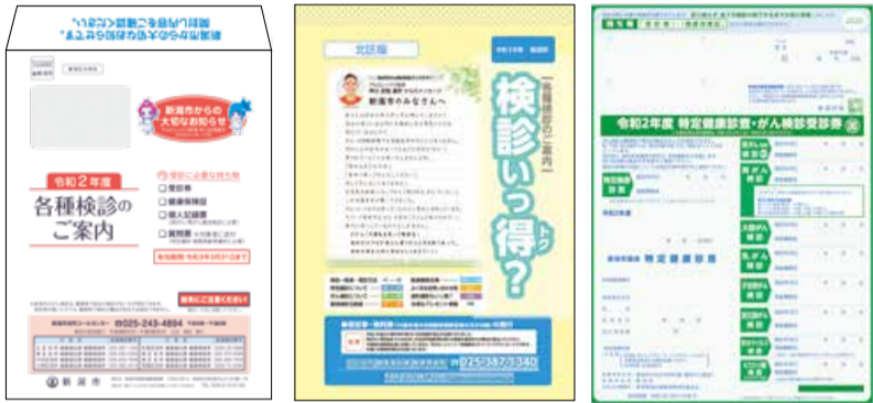
お送りした封筒 検診案内冊子 受診券

お送りした封筒の中には「検診案内冊子」と「受診券」が入っています。 ※3月下旬から順次発送しています。届くまでに2〜3週間程度かかることがあります