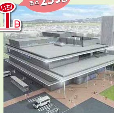
完成予想CG (令和4年度末時点)

☎地域総務課(☎387-1125、FAX387-1020、メールアドレス chii kisomu.n@city.niigata.lg.jp)