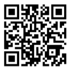
スマートフォンはこちらから