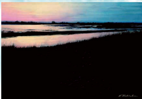
月岡徳恵「太古に還る刻」