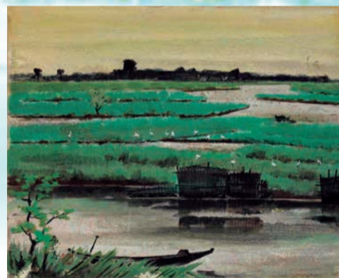
高野常与志「福島潟」