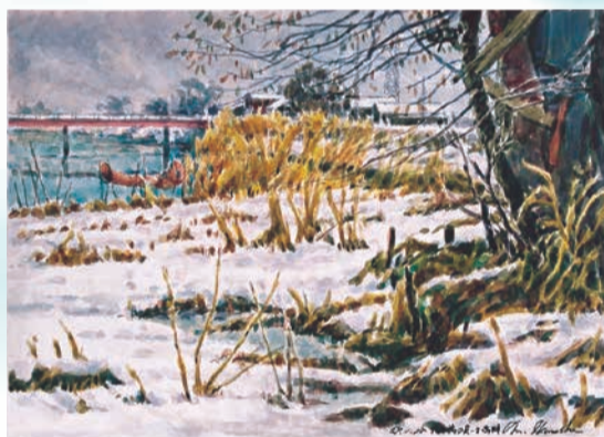
五十嵐道雄「潟口橋の見える潟畔」