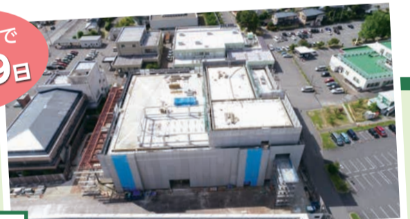
▲建設中の新庁舎(R2.6撮影)

今回は新庁舎の移転場所を紹介します。新庁舎は11月末(予定)に工事が終わり、来年2月1日にオープンしますが、その後も周辺施設の解体工事や駐車場の整備工事を行い、令和5年3月(予定)に全ての工事が終了となります。