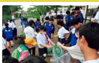
木崎中学校 クリーン作戦