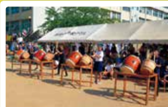
松浜中学校 体育祭 松浜盆踊り