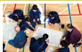
濁川中学校 地域を語ろう