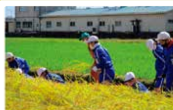
木崎小学校 米作り