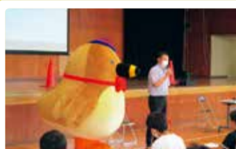
葛塚小学校 葛塚グルメプロジェクト「葛塚のよさを伝えよう」