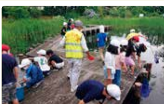
濁川小学校 発見! にごり川のじまん