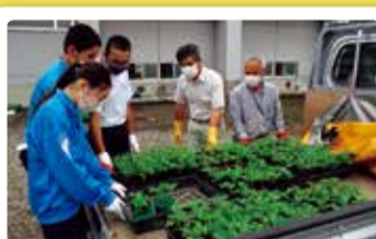
岡方中学校 岡方花の陣! ~咲き誇れ 地域の絆~