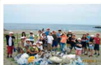
太夫浜小学校 ウミガメ復活プロジェクト 海岸清掃