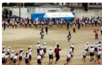
松浜小学校 運動会 生演奏で松浜盆踊り