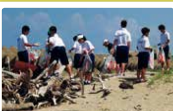
南浜中学校 海岸清掃で地域貢献

市では、「学・社・民の融合による教育」を進め、学校が今まで以上に地域に開かれ、地域と共に歩むことができるよう「地域と学校パートナーシップ事業」を行っています。区内全ての小・中学校に配置されている地域教育コーディネーターは、地域の学校支援ボランティアと共に、さまざまな形で子どもたちの教育に関わっています。