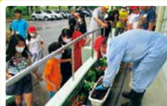
早通南小学校 花の苗植え