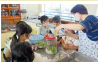
豊栄南小学校 梅みそ・梅干し・梅ジュース作り