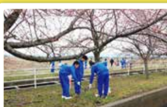
早通中学校 桜並木清掃