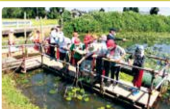
岡方第一小学校 未来に残そう! 地域の宝 十二湯