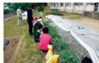
南浜小学校 南浜農園 スイカのお世話