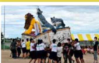
葛塚中学校 地域に活気を! 灯籠プロジェクト