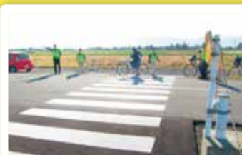
光晴中学校 朝のあいさつ運動