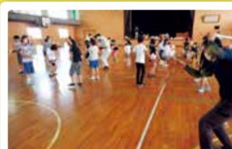
岡方第二小学校 高森いざや神楽練習