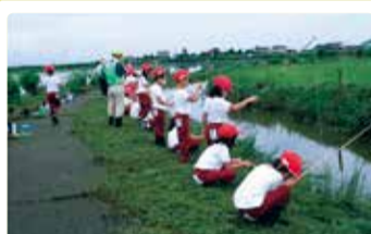
葛塚東小学校 福島潟でのザリガニ釣り