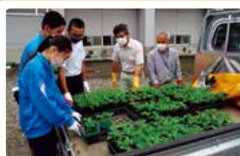
岡方中学校 岡方花の陣！～咲き誇れ 地域の絆～