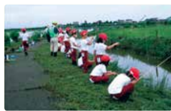
葛塚東小学校 福島潟でのザリガニ釣り