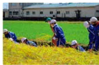
木崎小学校 米作り