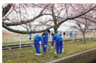
早通中学校 桜並木清掃