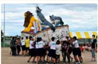
葛塚中学校 地域に活気を！灯籠プロジェクト