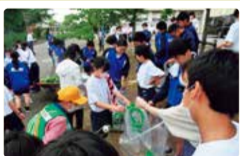
木崎中学校 クリーン作戦