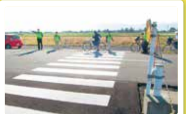
光晴中学校 朝のあいさつ運動