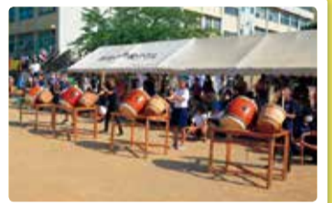
松浜中学校 体育祭 松浜盆踊り