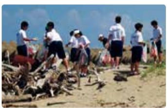
南浜中学校 海岸清掃で地域貢献