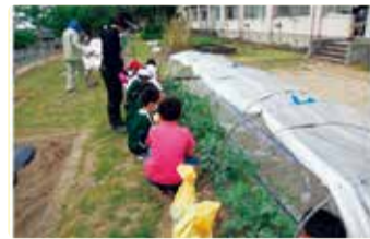
南浜小学校 南浜農園 スイカのお世話