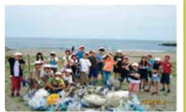
太夫浜小学校 ウミガメ復活プロジェクト 海岸清掃