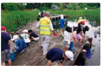
濁川小学校 発見！にごり川のじまん