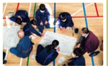
濁川中学校 地域を語ろう