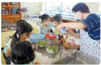
豊栄南小学校 梅みそ・梅干し・梅ジュース作り