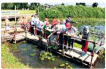
岡方第一小学校 未来に残そう！地域の宝 十二湯