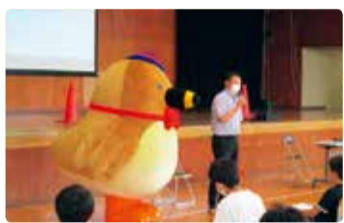
葛塚小学校 葛塚グルメプロジェクト「葛塚のよさを伝えよう」