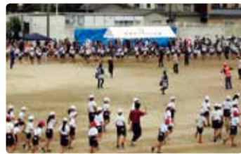
松浜小学校 運動会 生演奏で松浜盆踊り