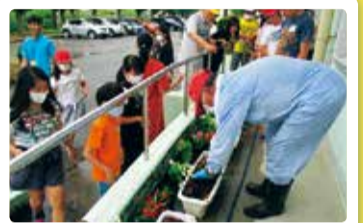
早通南小学校 花の苗植え