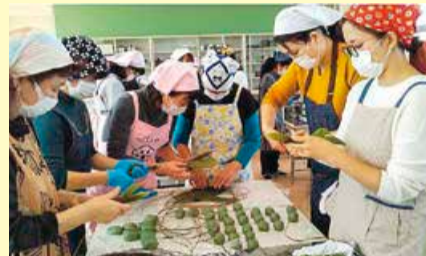
早通南小学校で団子づくり