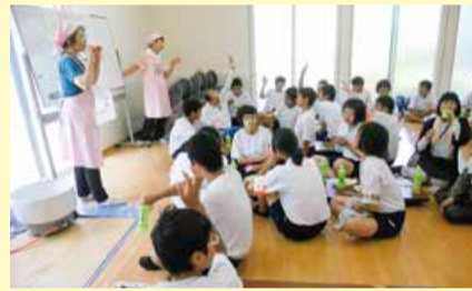
光晴中学校地域貢献活動でミニ講話とカレー作り