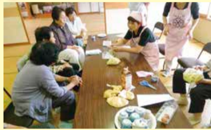
上黒山四地区ふれあい会館でパッククッキング講習会