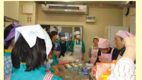
松浜中学校でパッククッキング講座