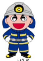
新潟市消防局 マスコットキャラクター 消太くん

文化財は市民の貴重な財産です。地域の皆さんで文化財を火災から守りましょう。 回 1月26日(火)午前9時半～10時 場 北区郷土博物館