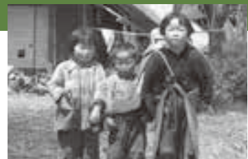
弟妹の子守り 昭和30年頃