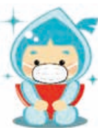
新潟市下水道キャラクター 水玉ぼうし