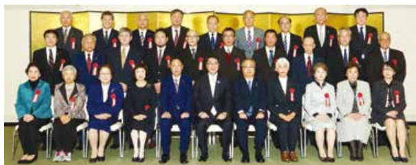
受章者のみなさん