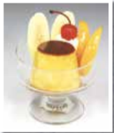
レストランダイワ 食品サンプル(プリンパフェ) 新潟市歴史博物館所蔵