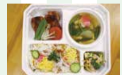
※春日和※ちらし寿司弁当

販売期間 3月31日(木)まで 販売場所 わくわくファーム豊栄店(かぶとやま)※午前10時半頃から 価格 各540円(税込) 販売数(予定) 平日 各20個 土・日曜、祝日 各30個 問 食と花の推進課(☎226-1844)