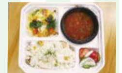
内面から美しく！カラダ喜ぶ春野菜弁当

同大学健康栄養学科の2年生とわくわくファームが考案した地元食材を使った栄養バランスの良い弁当を期間限定で販売しています。