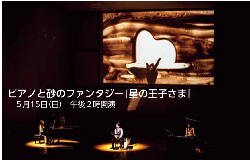
ピアノと砂のファンタジー『星の王子さま』 5月15日(日) 午後2時開演

名作童話『星の王子さま』を朗読とピアノとサンドアートで紡ぐ。 チケット発売中 一般2,000円 小学生～高校生1,000円 親子ペア券2,800円