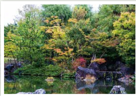
入選 「彩の秋 濁川公園」