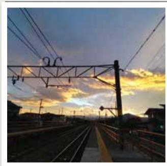
入選 「朝日」

※投稿者名は本人の希望により本名またはInstagramアカウント名等で表記(敬称略)