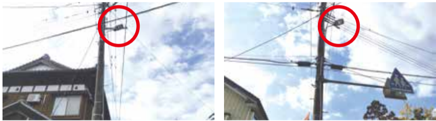
※1月15日号2面に掲載した写真が誤っていたので訂正して掲載しました

照明更新により周辺が明るくなり、より安全に通行することができるようになりました。