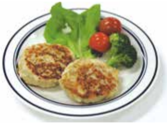
〈1人当たりの栄養価(食品成分表8訂) エネルギー：346kcal たんぱく質：19.3g 脂質：17.8g 炭水化物：19.6g 食塩相当量：1.4g〉