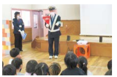
保育園の交通安全教室

小学校・保育園などで交通安全の大切さを伝える「交通安全指導員」を募集しています。 各種研修に参加する機会があり、未経験者でも登録可能です。 謝礼 1回2時間以上の活動につき6,200円 申 区民生活課生活環境係 (☎387-1295)