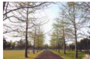
イチョウ並木 これから新緑が広がります

遊具やドッグラン、広い芝生広場などがあり、家族みんなで遊べます。イチョウ並木はおすすめフォトスポットです。