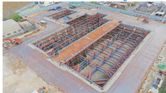
※建設途中の調整池