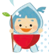
下水道キャラクター「水玉ぼうし」