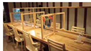
女性用のパウダールーム

嘉山亭は月岡温泉の観光客など、県内外の人に多く足を運んでいただいています。また、福島潟を散策した後や、昼休憩や普段の散歩のついでに寄ってくださる人も多くいて、地域のハブのようになってきていると感じています。