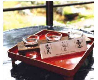
有料試飲セットの見本