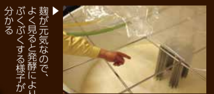
▲麴が元氣なので、よく見ると発酵によりぶくぶくする様子が分かる

約20日発酵させたものを压榨機にかけ、清酒と酒かすに分けます。絞ったお酒に炭素を入れ、火入れ(加熱殺菌)します。