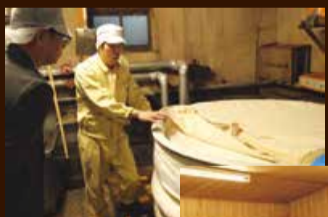
こしき (米を蒸す大型の蒸籠)に入った米

精米、洗米をした米を浸漬し、50分間蒸し上げます。8時から作業するため、作業に間に合うように朝早くから火入れをします。