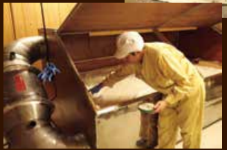
▲麴菌を繁殖させる様子 これからファンが回転し、表面を乾燥させ、麴菌を食い込ませる

麴室の温度は約33度。もやしと呼ばれる麴菌を蒸米にかけます。翌朝には麴菌が繁殖してつやつやと、白い点々ができます。さらに麴菌が繁殖して温度が40度くらいになると、麴菌を米の中心部に食い込ませる作業をします。