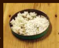
麴菌の繁殖が進み、ほんのり栗のような甘い香りが出る