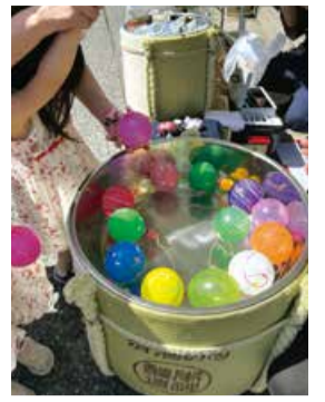
葛塚うまいもん市場出店の様子

葛塚うまいもん市場に出店し、「冷やしサイダー」や「ヨーヨーすくい」など、お酒を飲まない人にも楽しんでいただける工夫をしています。