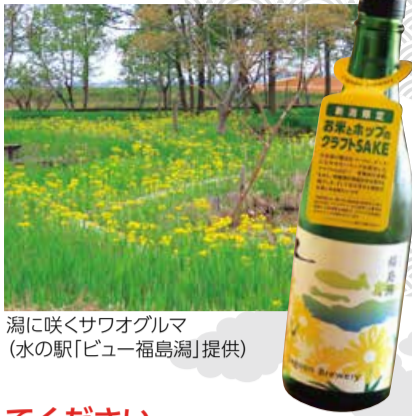
潟に咲くサワオグルマ (水の駅「ビュー福島潟」提供)

品名は「Hopped 福島潟」でホップも効かせたお酒です。新潟の皆さんにこそ手に取っていただいて、「福島潟ってこんなのあるんだ」と、福島潟に来ていただくきっかけになればと思っています。