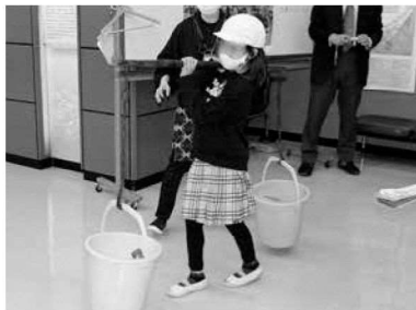
木崎小学校3年生 (天秤棒で水運び体験)