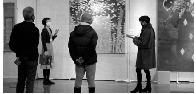
「型とシンボル展」作品鑑賞会