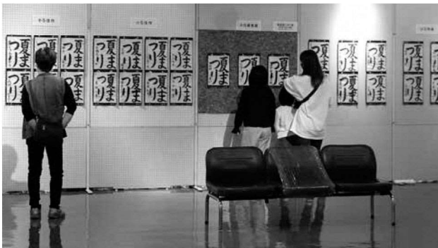
第23回 松蔭賞書道展