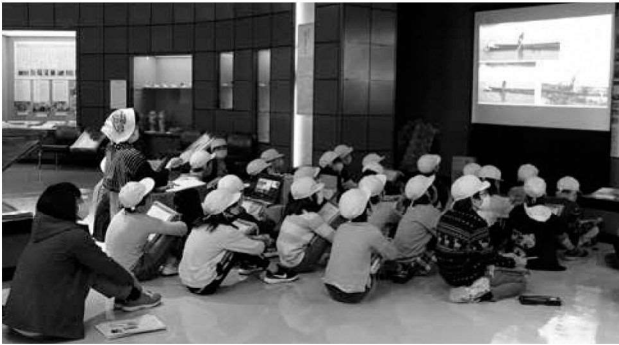
葛塚東小学校4年生 福島潟の干拓の歴史