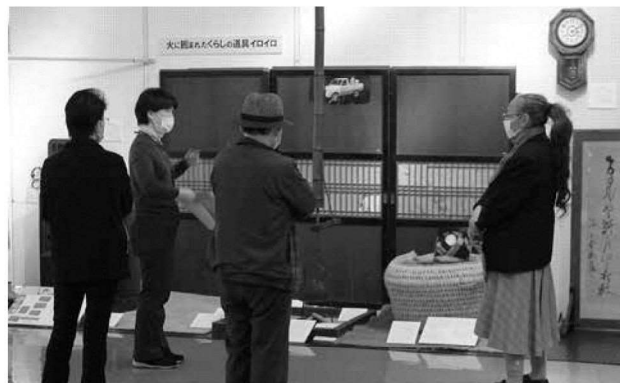
「昭和暮らし展」展示解説会