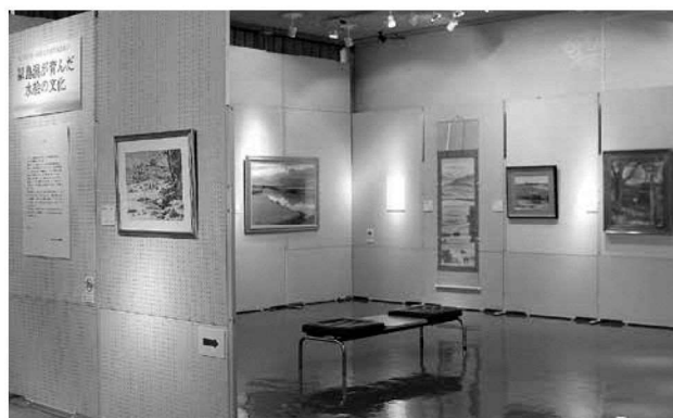
福島潟が育んだ水絵の文化