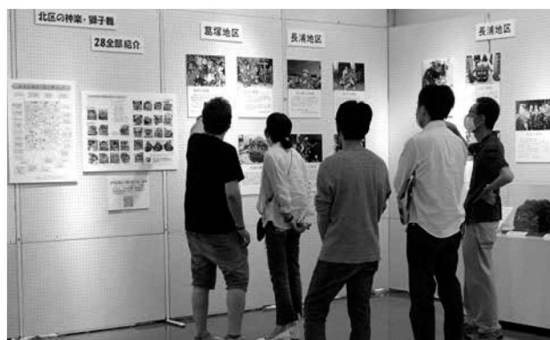
北区の神楽と獅子舞のここに注目展