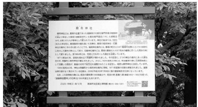
右下に二次元コードを追加した文化財等説明板(開市神社)