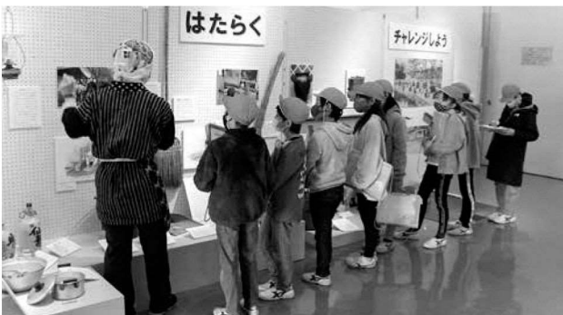
葛塚小学校3年生 かわる道具とくらし (昭和のくらし展 見学)