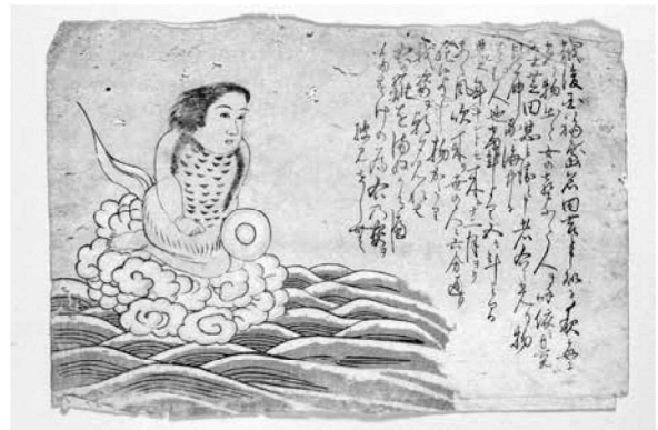
新潟県立歴史博物館蔵「光り物 刷物」

令和2年度は北区の歴史と疫病との関連を意識した1年でした。今後、1日も早くこのウイルスが完全に終息し、以前の日常に戻ることを祈ってやみません。