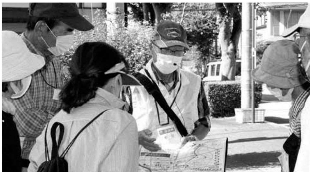
葛塚コース(北宝隊によるガイド)