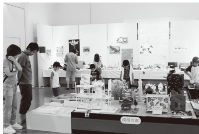
第9回新潟市北区子ども科学展