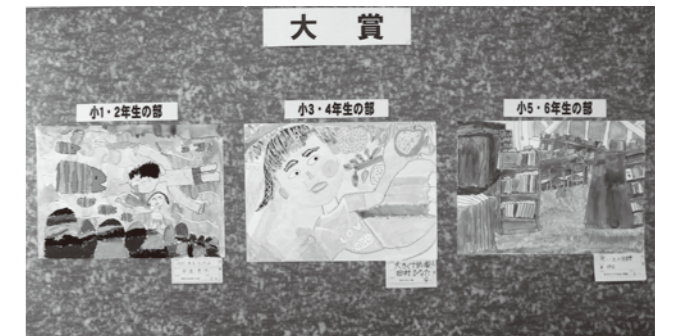
第9回新潟市北区ジュニア絵画展 大賞受賞作品