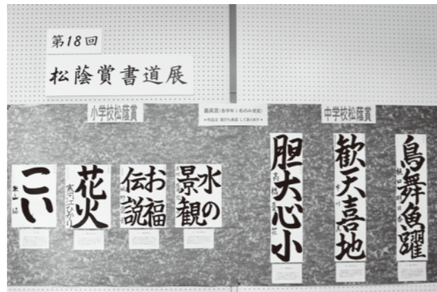
第18回松蔭賞書道展 松蔭賞受賞作品