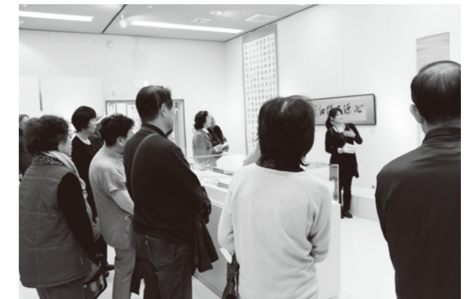
弦巻松蔭展Ⅱ 展覧会鑑賞ガイド(12/20)