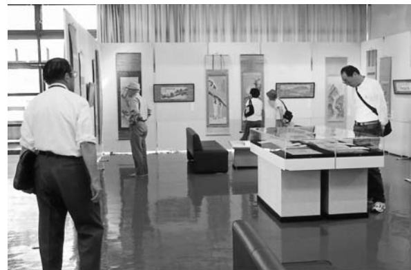
指頭画家 味方海山展