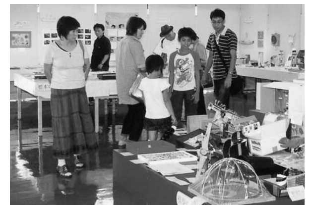
第4回 新潟市北区こども科学展