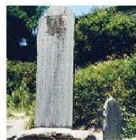
殉難碑と墓石 (松浜本町2)

1867(慶応3)年の大政奉還後、新政府が成立しても依然として旧幕府勢力が根強く、情勢は混沌としていました。翌年の1868(慶応4)年には、北越戊辰戦争が始まりました。新政府軍は、7月25日に太夫浜付近に上陸し、新発田藩の協力によって旧幕府軍の軍需補給地である新潟港を制圧しました。この動乱期に活躍した北区ゆかりの人々を紹介します。