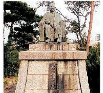
▲地区の繁栄を見守る小熊幸一郎像