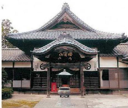
▲塔婆山金龍庵の境内に天曝観音がある。

村人はその功績をたたえ、境内に「里道改築碑」や幸一郎像を建立しました。集落内にも同様に「里道修築碑」があります。