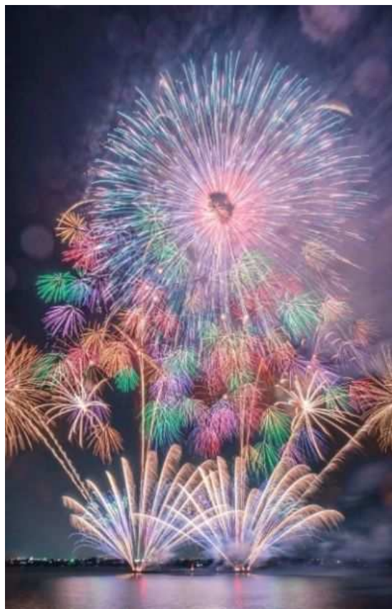
阿賀野川ござれや花火