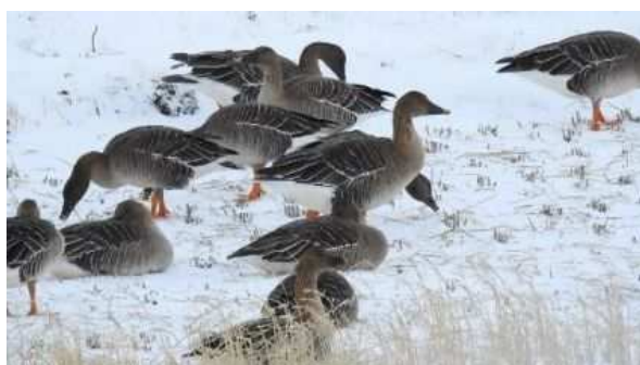
飛来するオオヒシクイ