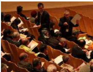
付箋で来場者と登壇者 双方向的に意見交換