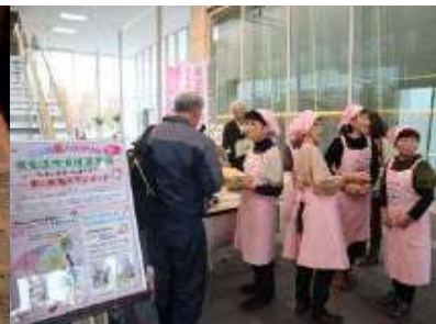
食生活改善推進委員 パッキングをPR