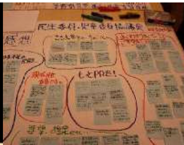
会場から集まった付箋 意見をグループ分け