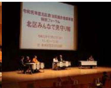
ディスカッション 課題や将来像を討論