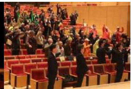
北区をみんなで見守る 各団体の一体感を高める