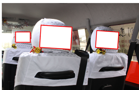
車内・座席後部（全6カ所）