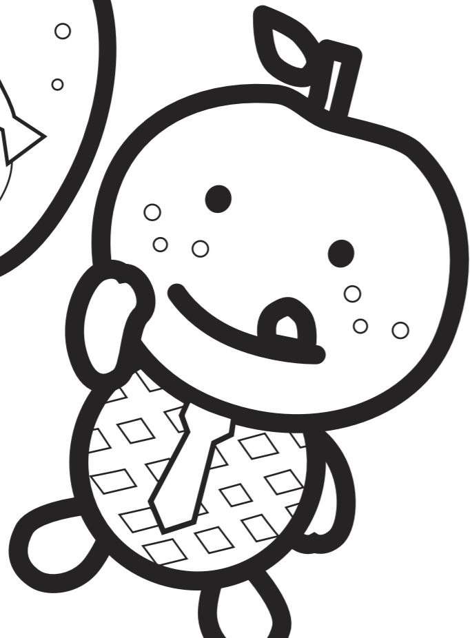
たか かりちょう 高ナシ係長