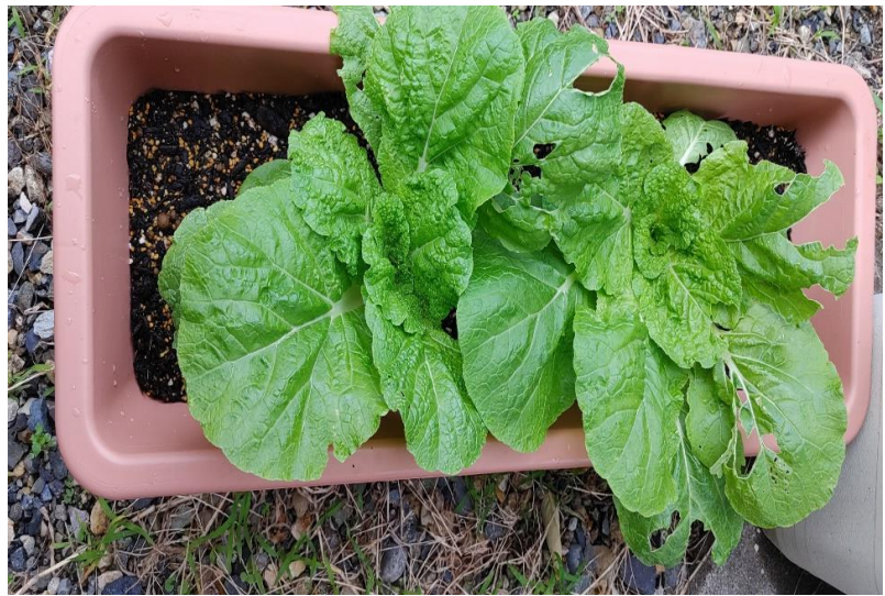
白菜大きくなってきました