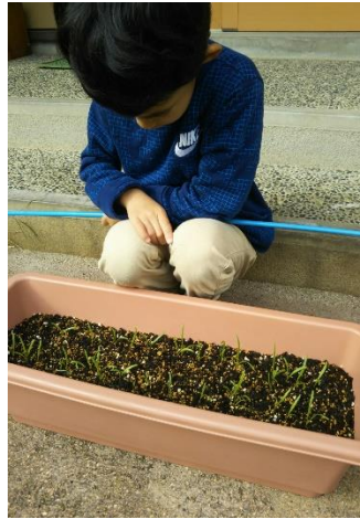
ほうれん草の発芽