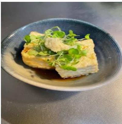
間引きしたカブ菜