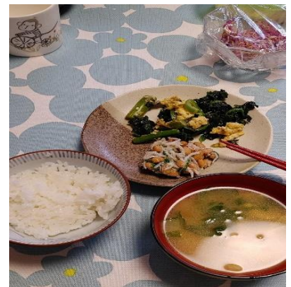
カブ菜の和え物・白菜の味噌汁