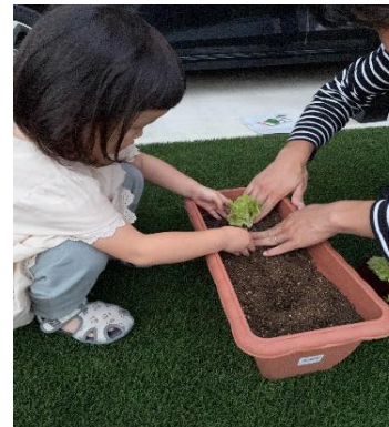
サニーレタスの植付の様子