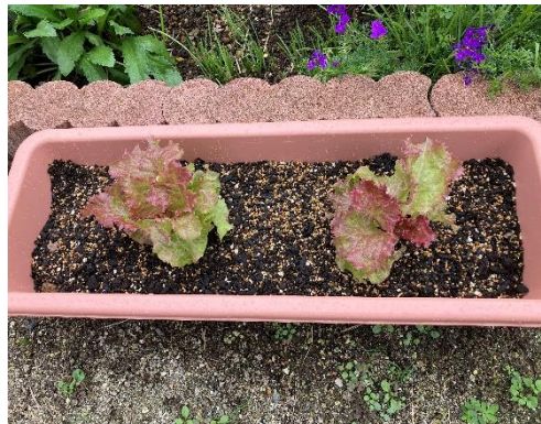
サニーレタスの植付