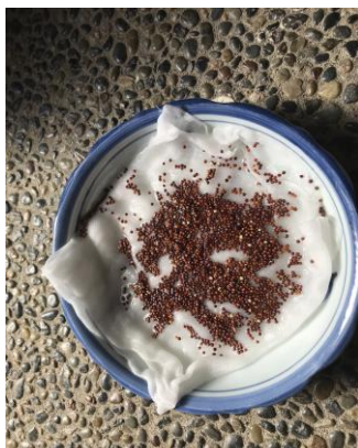
小カブの種まきの準備