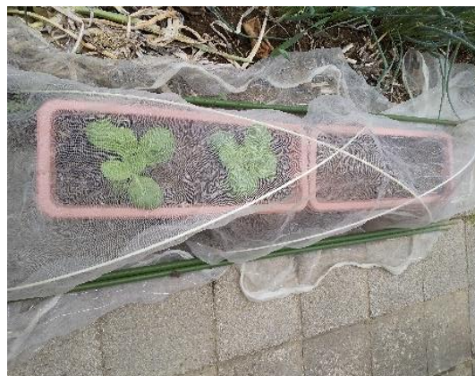
白菜と小カブの植付