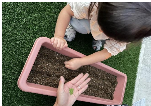
ほうれん草の種まき