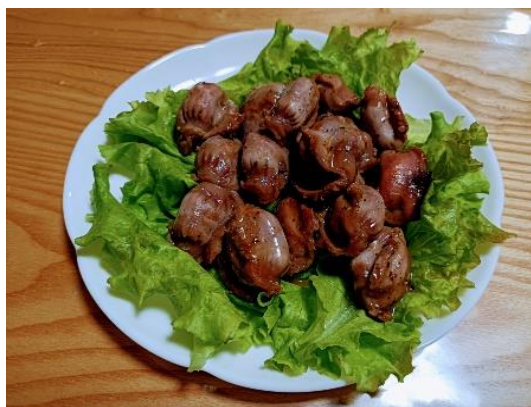
サニーレタスと砂肝