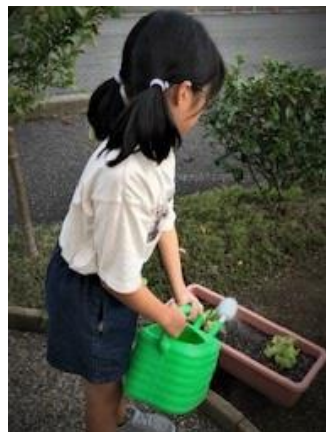
サニーレタスの水やり