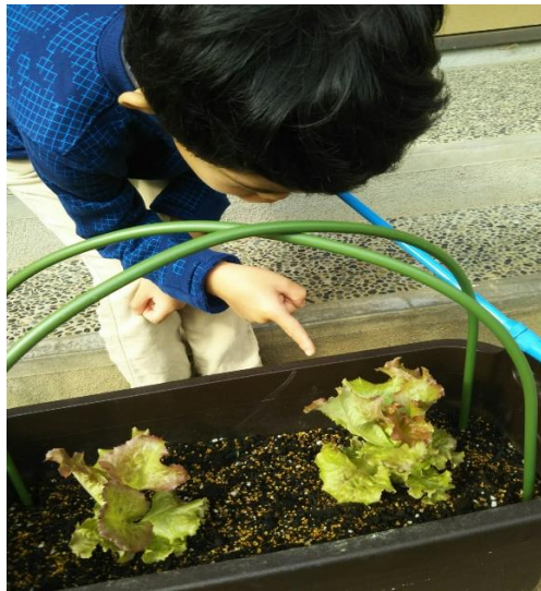
サニーレタスも順調です