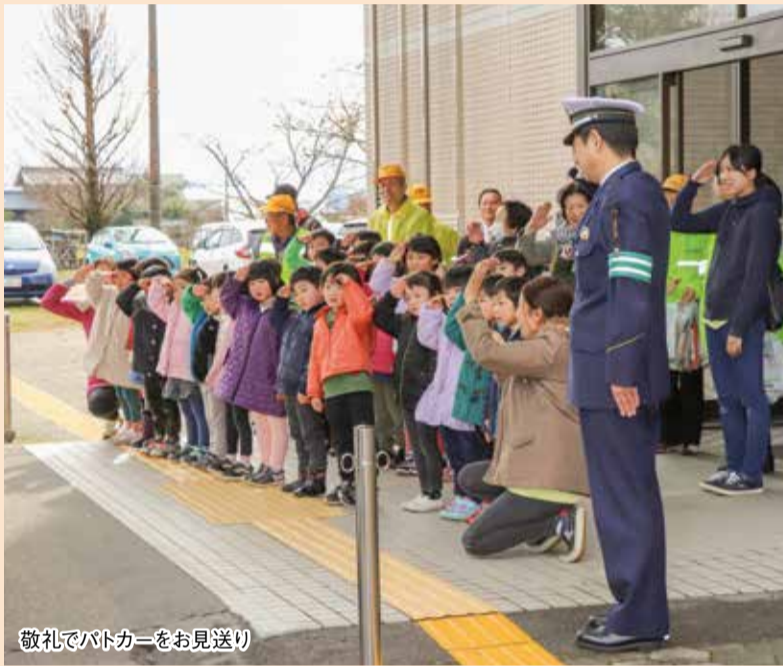
敬礼でパトカーをお見送り