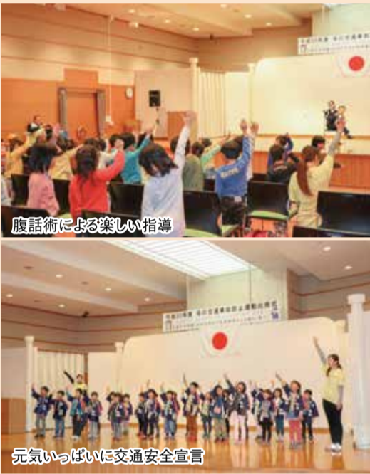
腹話術による楽しい指導