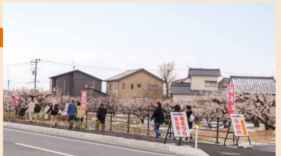
開通したばかりの梅の里通りを歩く参加者

お昼に近づくにつれ、陽が差して、いい天気。参加者は、梅の花の記念撮影などをしながら、ゆっくり散策を楽しみました。