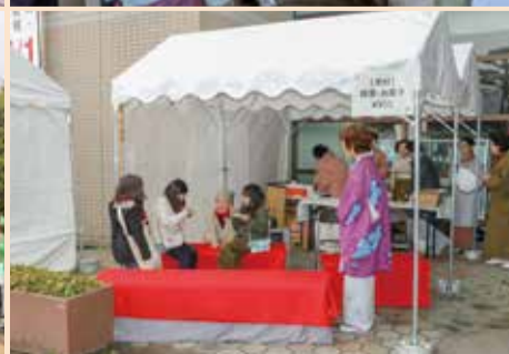
上：区役所前の梅もほぼ満開 下：区役所前では選挙の啓発運動も