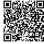
〈運行ルート・ダイヤ〉

横越出張所を乗換バス停として、横越全域を走るバス 運賃(先払い) 高校生以上 200円 小・中学生 100円 就学前児 無料 ※出張所での乗換えは無料