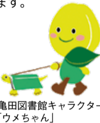
亀田図書館キャラクター「ウメちゃん」