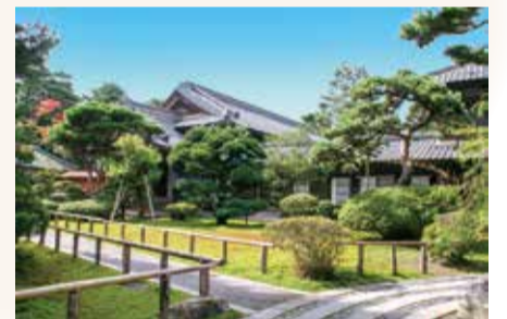
北方文化博物館 主屋

北方文化博物館 主屋・大広間ほか 〒950-0205 沢海2-15-25 北方文化博物館 TEL:025-385-2001 開館時間 4月-11月 9:00~17:00 <年中無休> 12月-3月 9:00~16:30 入館料 大人800円、小人400円