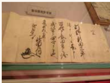
割野新田開発免許状

〒950-0144 茅野山3-1-14 江南区郷土資料館内 TEL:025-382-1157