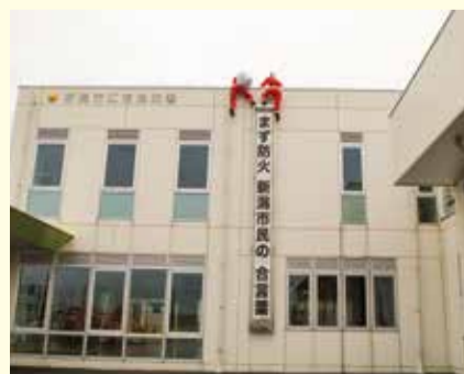
建物を登るサンタクロースは、12月25日(水)まで江南消防署(泉町3)で見ることができます。