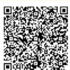
にいがた防災メール

メールへの登録やアプリのダウンロードは、市ホームページまたは以下の二次元コードを御確認ください。