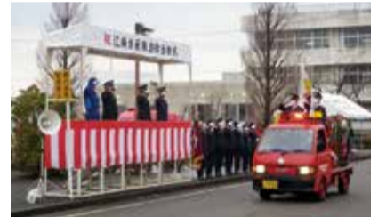
令和4年消防出初式の様子

自由に見学できます。 回 1月8日(日)午後2時～4時 場 江南区役所 敷地内 内 消防団車両などの行進 午後2時30分より2分間、隣接する亀田西中学校の北側道路で一斉放水を実施 場 江南消防署 地域防災課 ☎025-381-2327