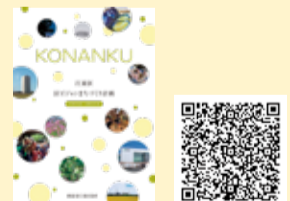
区ビジョンまちづくり計画