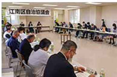
今年度の第1回自治協議会の様子

自治協議会には、 ①区民の声を反映させる ②委員自ら地域課題解決 という大きな2つの役割があるぞい。詳しくは、右の二次元コードを見るのじゃ。