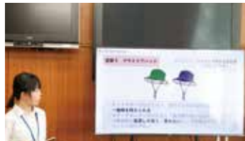
亀田縞の風通しのよさを活かしたアウトドアハットの提案