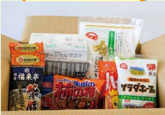
送付イメージ(昨年度の内容)