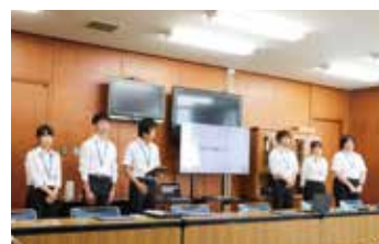
大学生によるアイデア提案

7月13日に、新潟大学創生学部の6人が、亀田縞を若者に親しんでもらうためのアイデア提案を行いました。関係先への訪問やインタビューなど、これまでの学外学修を踏まえ、若者向けカスタムトートバッグなどの製品のほか、亀田縞モチーフのミルクレープの製造・販売など、大学生目線での自由な提案がなされました。 参加した学生は「2か月間の活動で、亀田縞のことがもっと好きになった」「実現の可能性を考慮しながら、アイデアをブラッシュアップしていきたい」と話していました。 今後は、今回の発表で関係者から受けたフィードバックを踏まえ、大学内での最終プレゼンに向けて学修成果のまとめを行っていきます。 問 産業振興課 ☎025-382-4809