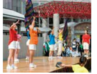
ふれ愛ステージでのダンスパフォーマンス

障がいのある人とない人、また多世代の人が交流することで、区地域福祉計画の基本理念「みんなでささえあい安心して暮らせるまち“江南区”」を実現するため、交流事業を開催します。 今年度も「ともにアート展」を同時開催します。