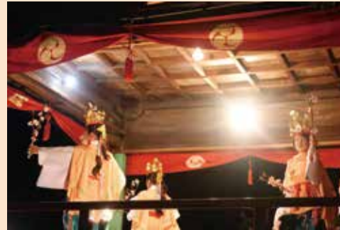
華やかな衣装や小道具を使った花舞(稚児舞)